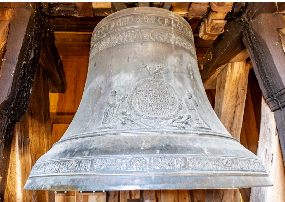
Renesanční zvon ve věži kostela sv. Martina (Roman Šulc, 2019)