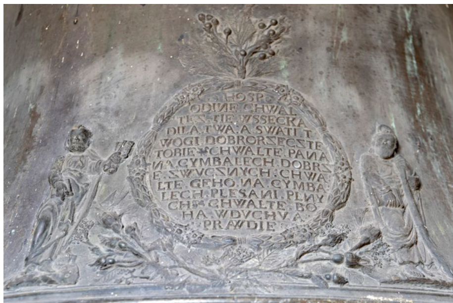
a detail nápisu na zvonu (Roman Šulc, 2019)