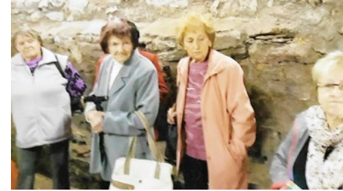
Prvním bylo podzemí v Českém Brodě.

V letošním roce jsme podnikly tři výlety.