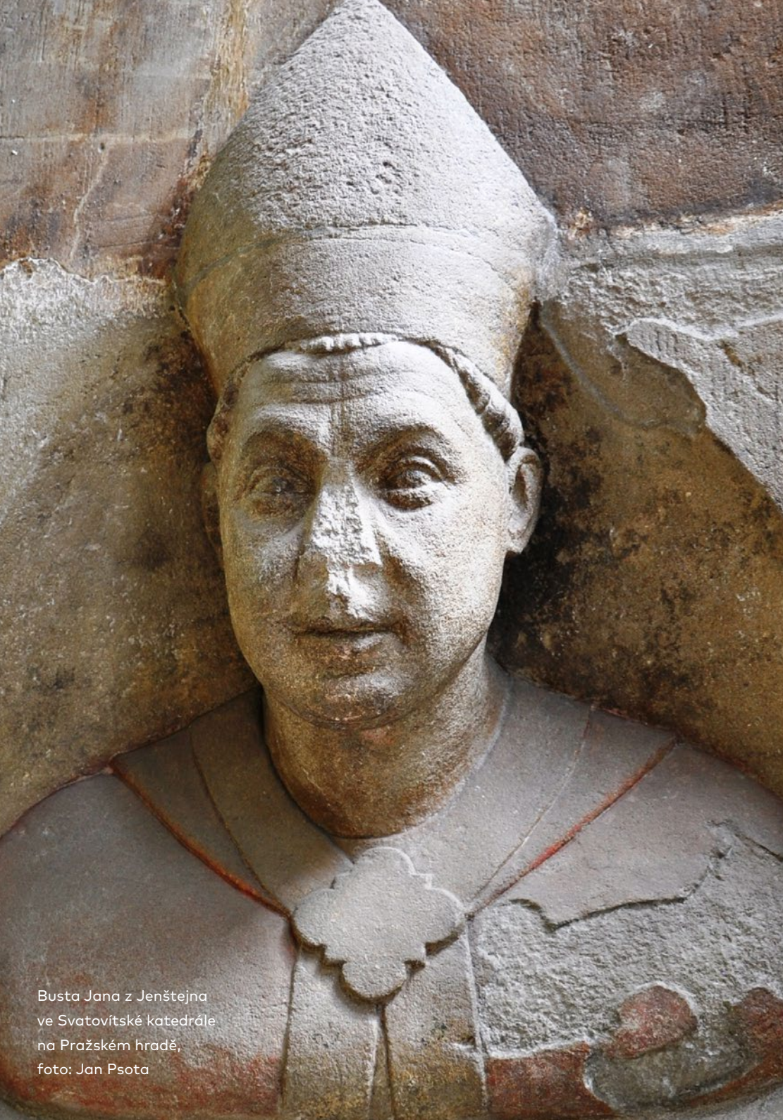
Busta Jana z Jenštejna ve Svatovítské katedrále na Pražském hradě