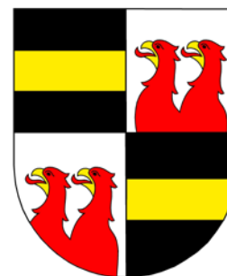
Erb arcibiskupa Jana z Jenštejna