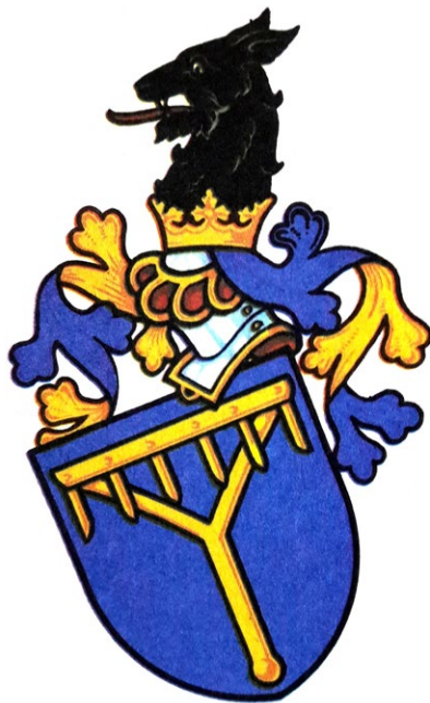
Znak rytířů Kostků z Postupic

Pohrobka vyprosil za dosud prokázané služby manskou odúmrtí v Myšlíně po† Vikěřovi, která po svolání spadla zpět na krále. Statek obsahoval: tvrz Myšlín, Třemblat a Hlavačov u Ondřejova,