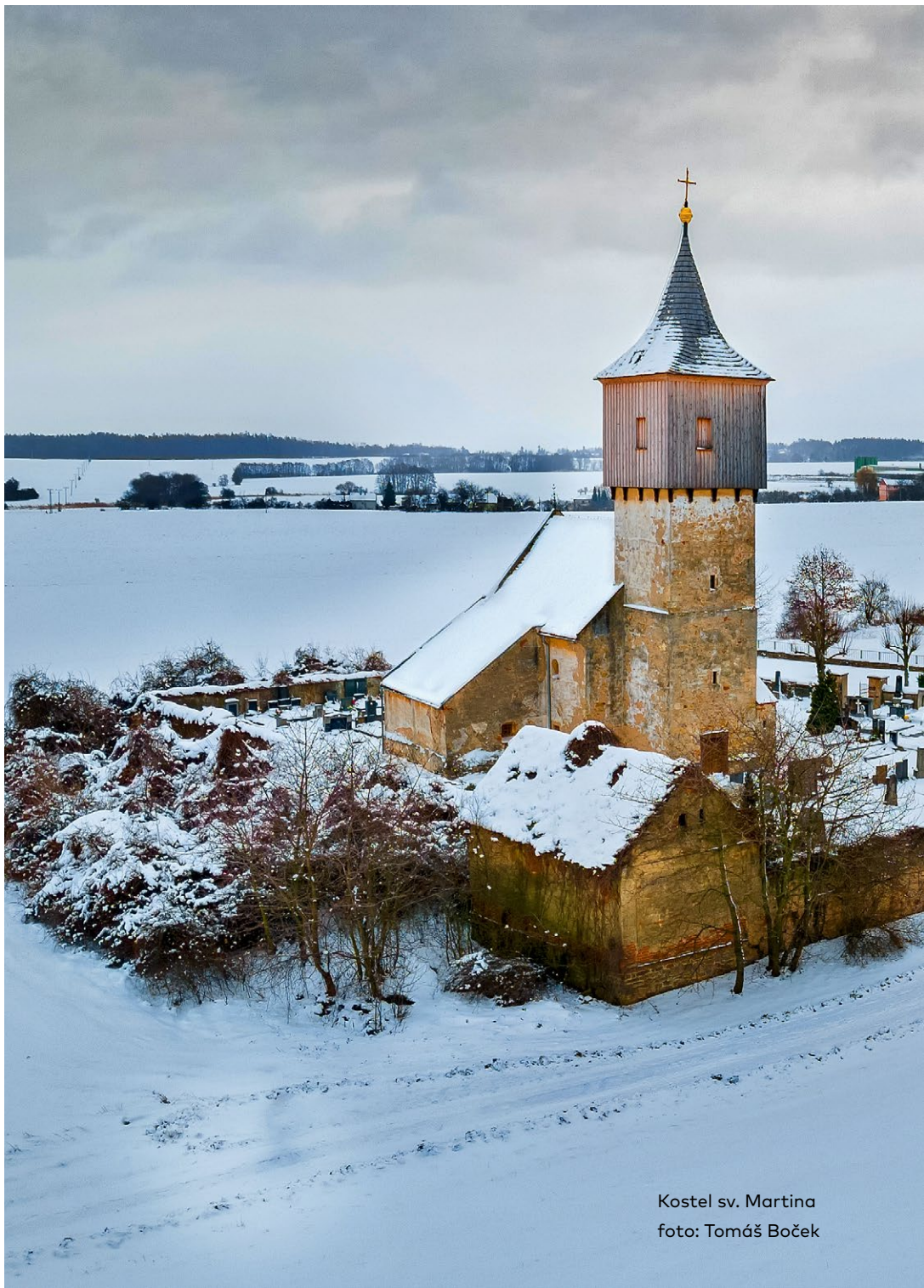
Kostel sv. Martina